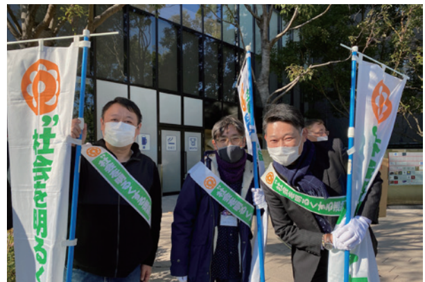
文京区立小学校 PTA 連合会の皆さん