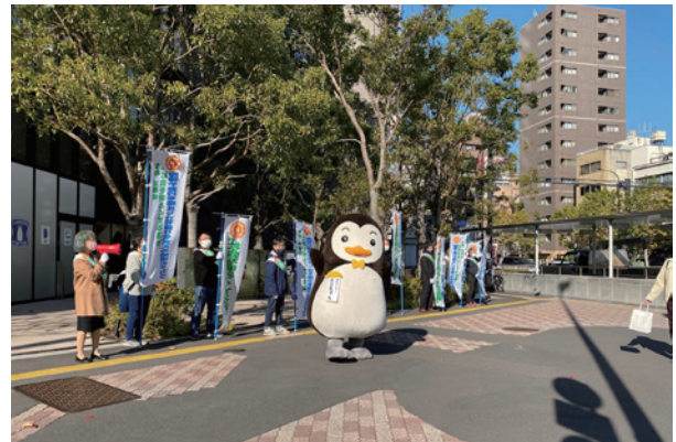
春日町交差点付近での活動