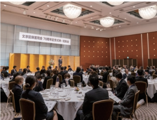
教育長 加藤裕一様 祝辞