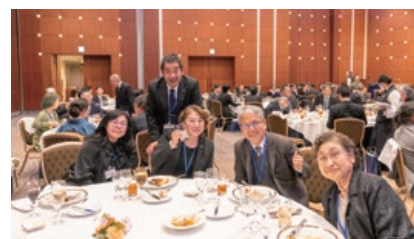
70周年を祝う保護司会メンバー