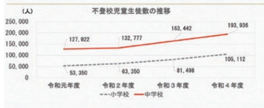
図2 本区の不登校の現状①人数