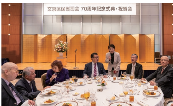
来賓の皆様との懇親