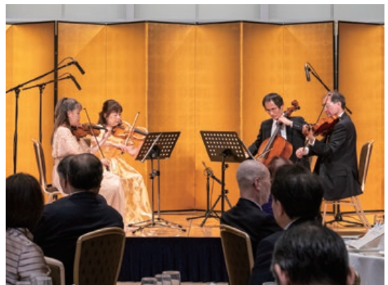
イリス弦楽四重奏団による演奏