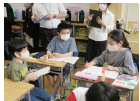
グループで話し合う