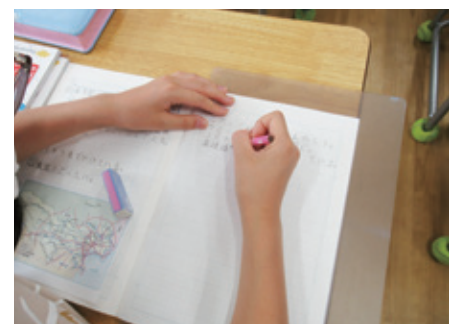
自分で考えまとめる