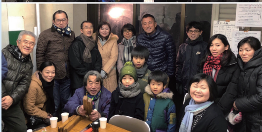
外は寒いが詰所の中はあったか