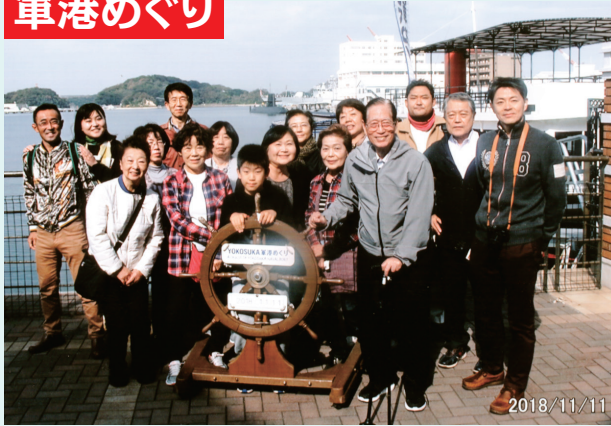
乗船前、皆でわくわくの参加者たち