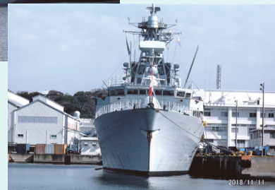
外国のイージス艦なども見られました。