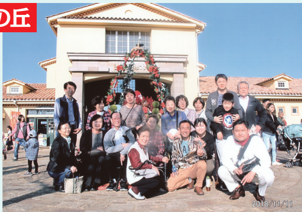
午後は青空のもと、テーマパークにて大満足…。