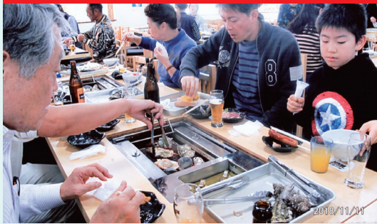
限られた時間で「まんぷく」になりました。