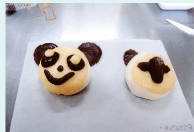
皆でオリジナルの「アニマルメロンパン」を作りました。