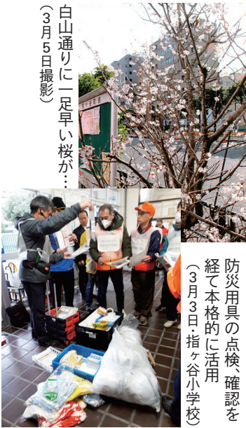
防災用具の点検、確認を 経て本格的に活用 (3月3日指ヶ谷小学校)