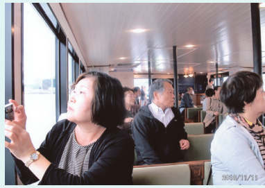
船内のコミカルなアナウンスを楽しみながら