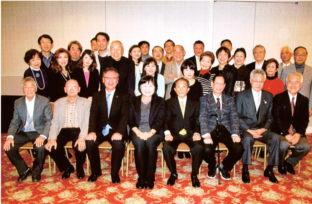
— 平成 31 年 1 月 26 日、後楽園飯店にて新年会を開催 —