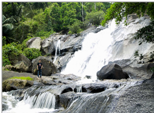
ナムヌン自然保護区

ナムヌン自然保護区（面積 21,865 ヘクタール）、ターズン自然保護区（面積 20,937.7 ヘクタール）、ドライサップ保護林（面積 1,405.6 ヘクタール）