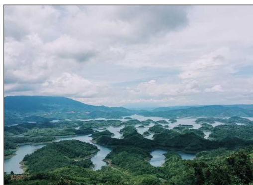
ターズン自然保護区